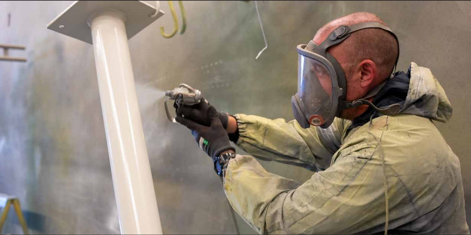
Plate- og sveisearbeid

Hos Glomsrød Mek. Verksted AS er vi stolte av å tilby et bredt spekter av produkter og tjenester. Med vår allsidige stab av erfarne fagfolk og dyktige ingeniører, står vi godt rustet til å møte kundenes behov – uansett hva oppdraget måtte være.