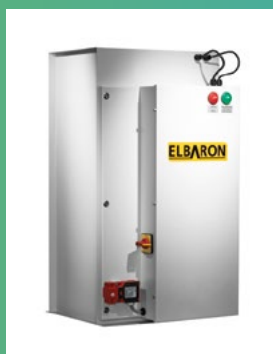
ELEKTROSTATISCHE LUFTREINIGER ELBARON

Spezialist in der Absaug- und Filtertechnologie von Schadstoffen in der Luft und im Schneidöl.