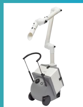
ULT-ABSAUG- & FILTERGERÄTE

+41 22 342 36 50 | elbaron@elbaron.ch | www.elbaron.ch